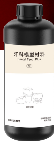
● A1/A2/A3 净重: 1 kg